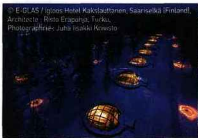
© E-GLAS / Igloos Hotel Kakslauttanan, Saariselkä (Finland), Architecte : Risto Eräpää, Turku, Photographier : Juhä Isäkki Kivisto