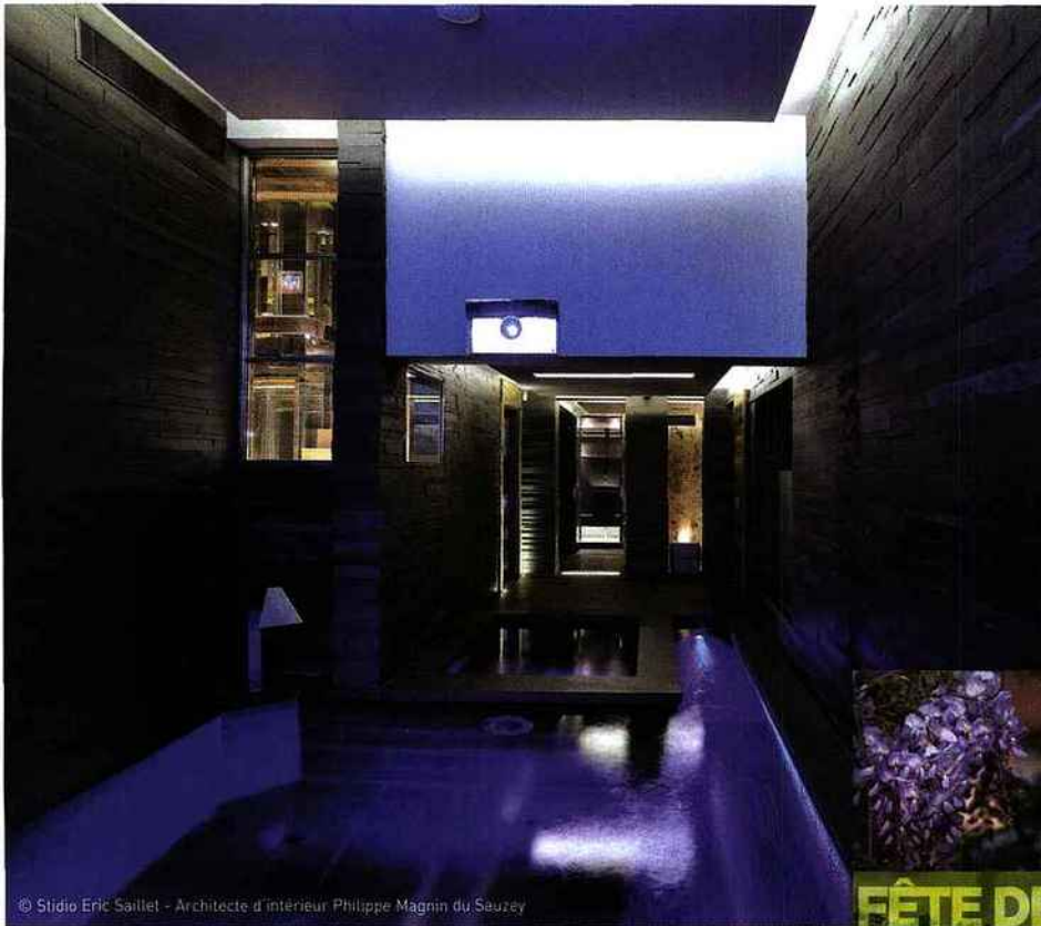
© Stúdio Eric Saillel - Architecte d'intérieur Philippe Magnin du Saëzey