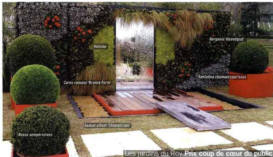
Les jardins du Roy Prix coup de cœur du public

Un imposant mur végétal (procédé Canevaflor) constitue le point d'orgue du décor, tout en assurant les isolations thermique et phonique. Il forme une mini-usine à dépolluer par biofiltration. Un grand bac récupérateur de l'eau de pluie évite une consommation d'eau inopportune. Les dalles Stradal sont fabriquées en matériau 100 % recyclable et posées sur un support drainant qui limite le ruissellement des eaux pluviales. La terrasse utilise un bois FSC. Superbe concept ! Paysagiste : Christian Roy