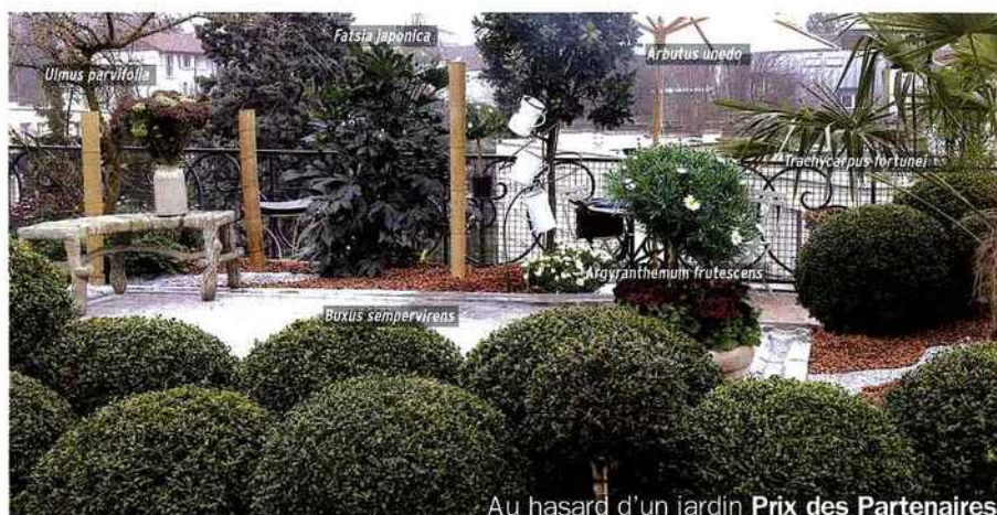
Au hasard d'un jardin Prix des Partenaires

Évoquant ce fabuleux jardin promontoire de Dordogne, il y a des rondeurs un peu partout avec des buis différents. L'idée est un jardin moderne fait de « récup », avec une petite fontaine fabriquée maison. Mais la grande originalité vient du paillis en coque de noisette, un résidu industriel de bonne longévité et très décoratif. Le dallage gris, plat et rond est du Bradstone Chelsea coloris Armor. Le banc en béton évoque ce qui se faisait au début du xx e siècle dans un esprit un peu kitsch. Paysagiste: Jean-Pierre Letellier