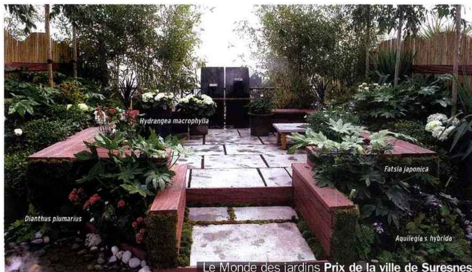
Le Monde des jardins Prix de la ville de Suresnes